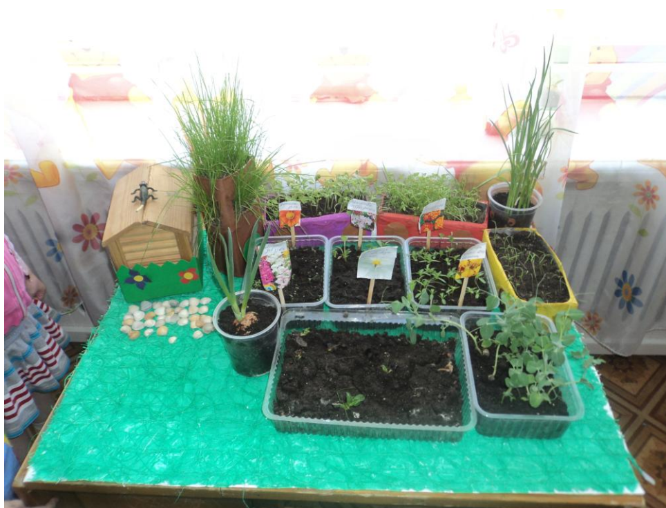
Группа №12 «Знатный будет урожай»