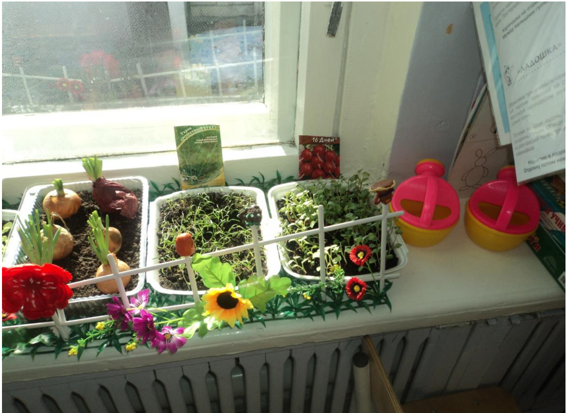
Группа №13 № «Веселый огород»